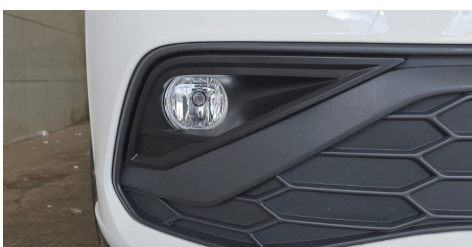
IMAGEM 4 - PRODUTO JÁ INSTALADO E PARAFUSADO CONFORME A FOTO