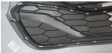
IMAGEM 1 - PARACHOQUE ORIGINAL

ATENÇÃO: Não utilizar em hipótese alguma, lâmpadas de H11 55W (risco de incêndio). Produto fabricado de acordo com os padrões originais.