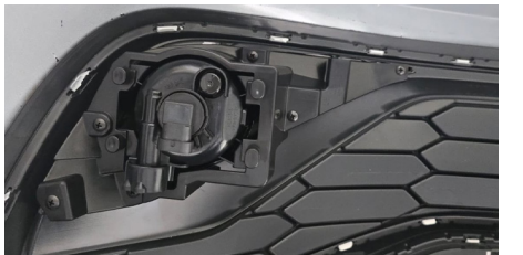
IMAGEM 3 - PRENDER CONFORME A FOTO