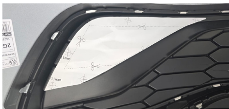
IMAGEM 2 - COLAR O GABARITO QUE ACOMPANHA O KIT DENTRO DA EMBALAGEM, RECORTAR CONFORME A MARCAÇÃO. (RECOMENDAMOS O USO DE UM SOPRADOR TÉRMICO E UM ESTILETE PARA O RECORTE)