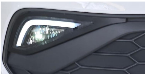
IMAGEM 4 - PRODUTO JÁ INSTALADO E PARAFUSADO CONFORME A FOTO