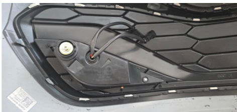
IMAGEM 3 - PRENDER CONFORME A FOTO