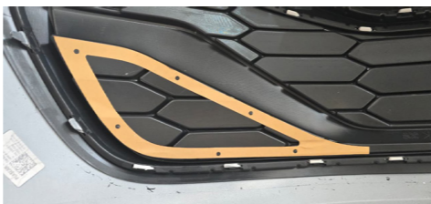
IMAGEM 2 - COLAR O GABARITO QUE ACOMPANHA O KIT DENTRO DA EMBALAGEM, RECORTAR CONFORME A MARCAÇÃO. (RECOMENDAMOS O USO DE UM SOPRADOR TÉRMICO E UM ESTILETE PARA O RECORTE)